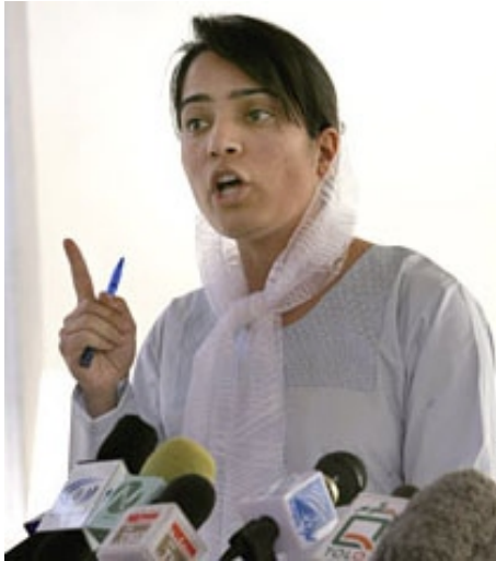
Malalai Joya, en una rueda de prensa en Kabul el 21 de Mayo de 2007 promete continuar su lucha contra los señores de la guerra.

Los señores de la guerra y los narcotraficantes han expulsado a Malalai Joya del parlamento Comité de Defensa para Malalai Joya (22 de Mayo de 2007)