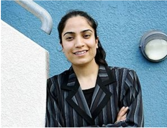
Malalai Joya, la más joven del Parlamento de Afganistán